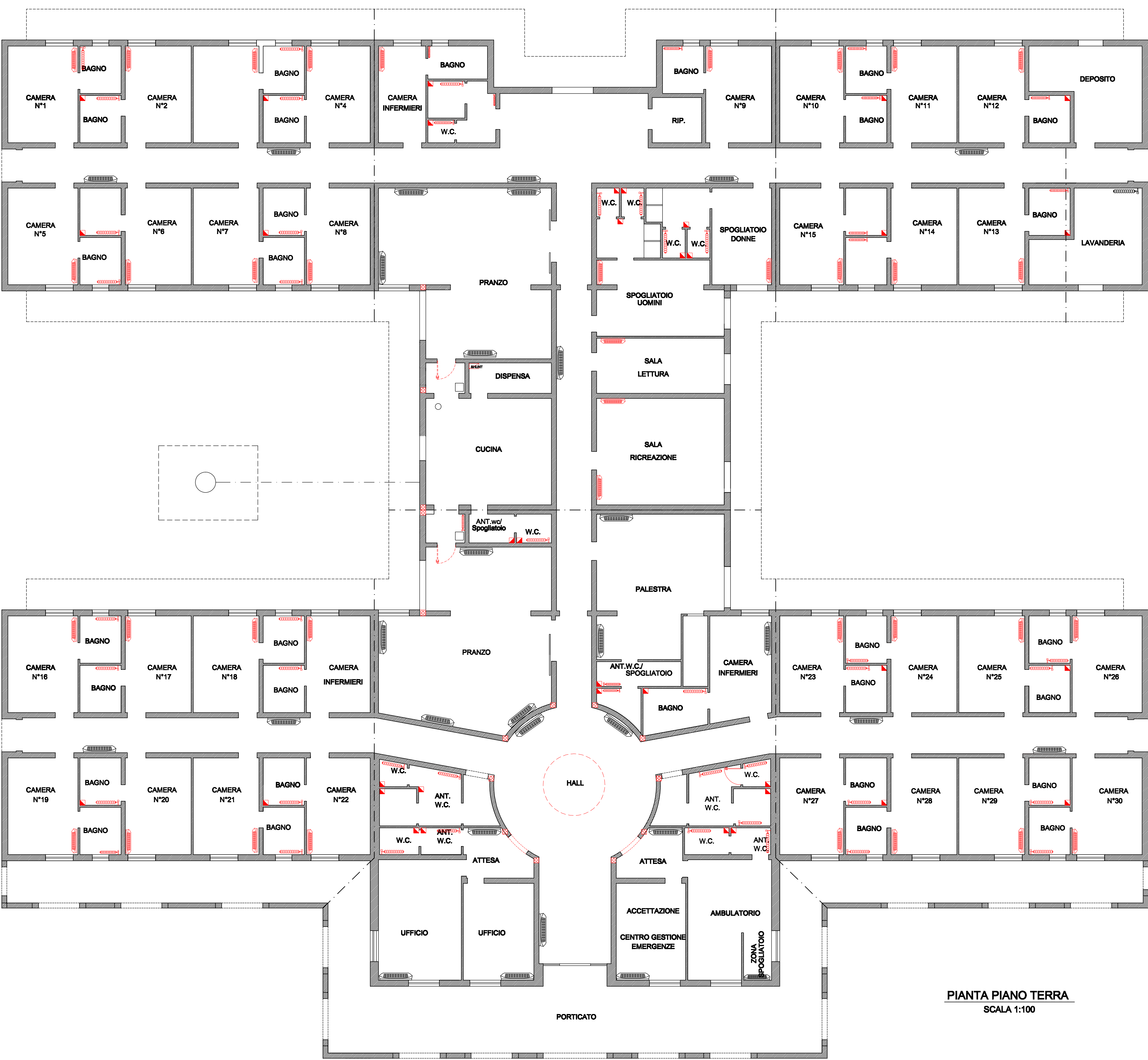
PIANTA PIANO TERRA SCALA 1:100